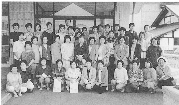
▲青森県田舎館村との交流会