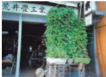
荒井畳工業 荒井 春夫

節電や町内の環境美化への取組として、緑のカーテンを数多くの方に実践していただきました。町では、これらの取組がより多くの方に実践していただけるよう、「緑のカーテンコンクール」として表彰を行いました。今回表彰の方を中心に緑のカーテンを町内で広めてまいります。