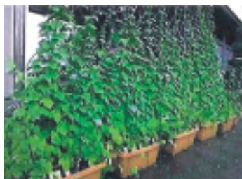
(株)坂下マイクロ エレクトロニクス工業