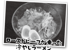
ローストビーフが乗った 冷やしラーメン