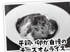
平飼卵が自慢の チーズオムライス