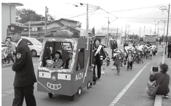
▶ポンプ車を模したパレードカーも登場