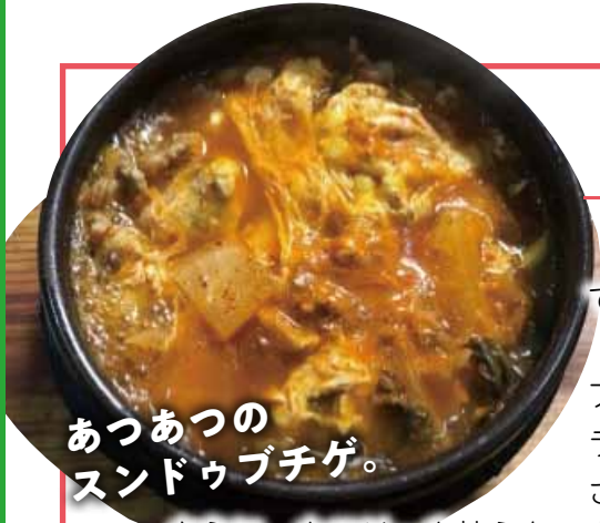
あつあつの スンドゥブチゲ。