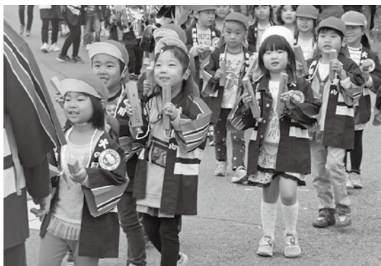
▶お揃いの法被で「火の用心」!