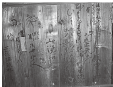
▲「喜多方市村松金比羅神社の飯豊山登拝同行墨書」