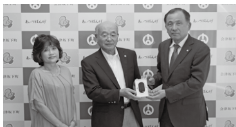
▶手に持つ多言語翻訳機は世界74か国語を翻訳可能

ライオンズクラブ様より多言語翻訳機「ポケットーク」1機が寄贈されました。「外国人の方が住民情報の登録で訪れる際、医療機関受診の際にも活用いただけたら。」と述べられました。現在、生活課窓口にて有効に活用させていただいています。当町には現在16か国約180名の外国人が生活しています。