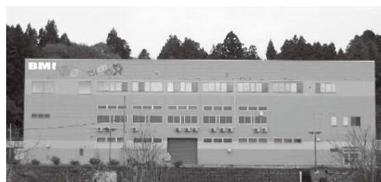
当社 坂下事業所マテリアルリサイクル(中間処理)施設