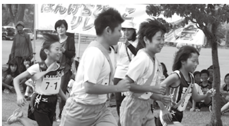
▶声援を受け、笑顔を見せる走る子どもたち

9月28日、ばんげひがし公園において「第12回ばんげちびっこリレーマラソン大会」が開催され、14チームが参加しました。高学年の部優勝チームは「風切るつばさ」、低学年の部優勝チームは「超特急チーム」でした。子どもたちは仲間たちにタスキをつなぐため、一生懸命に走っていました。